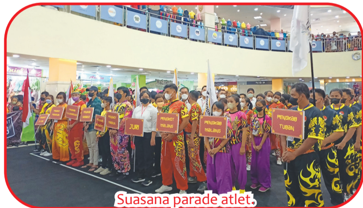
Suasana parade atlet.