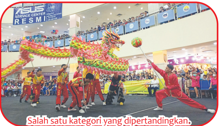
Salah satu kategori yang dipertandingkan.