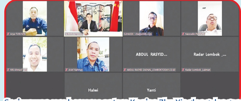
Sesi wawancara bersama antara Konjen Zhu Xinglong dengan para wartawan media utama NTB.

peringatan HUT ke-73 tahun Republik Rakyat Tiongkok dan Kongres Nasional Partai Komunis Tiongkok ke-20 mendatang. Sekaligus menjawab pertanyaan wartawan terkait hubungan Tiongkok-Indonesia, G20 Leaders Summit Bali, kerja sama ekonomi perdagangan Tiongkok-Indonesia serta hubungan antar daerah dan pertukaran lokal yang diajukan para wartawan. • idn/din