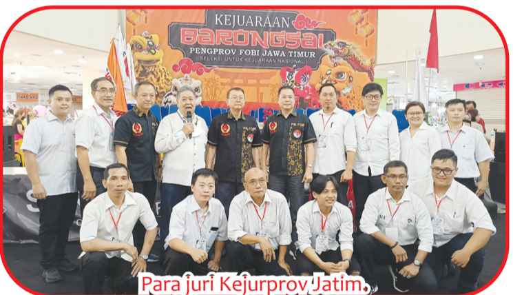
Para juri Kejurprov Jatim.