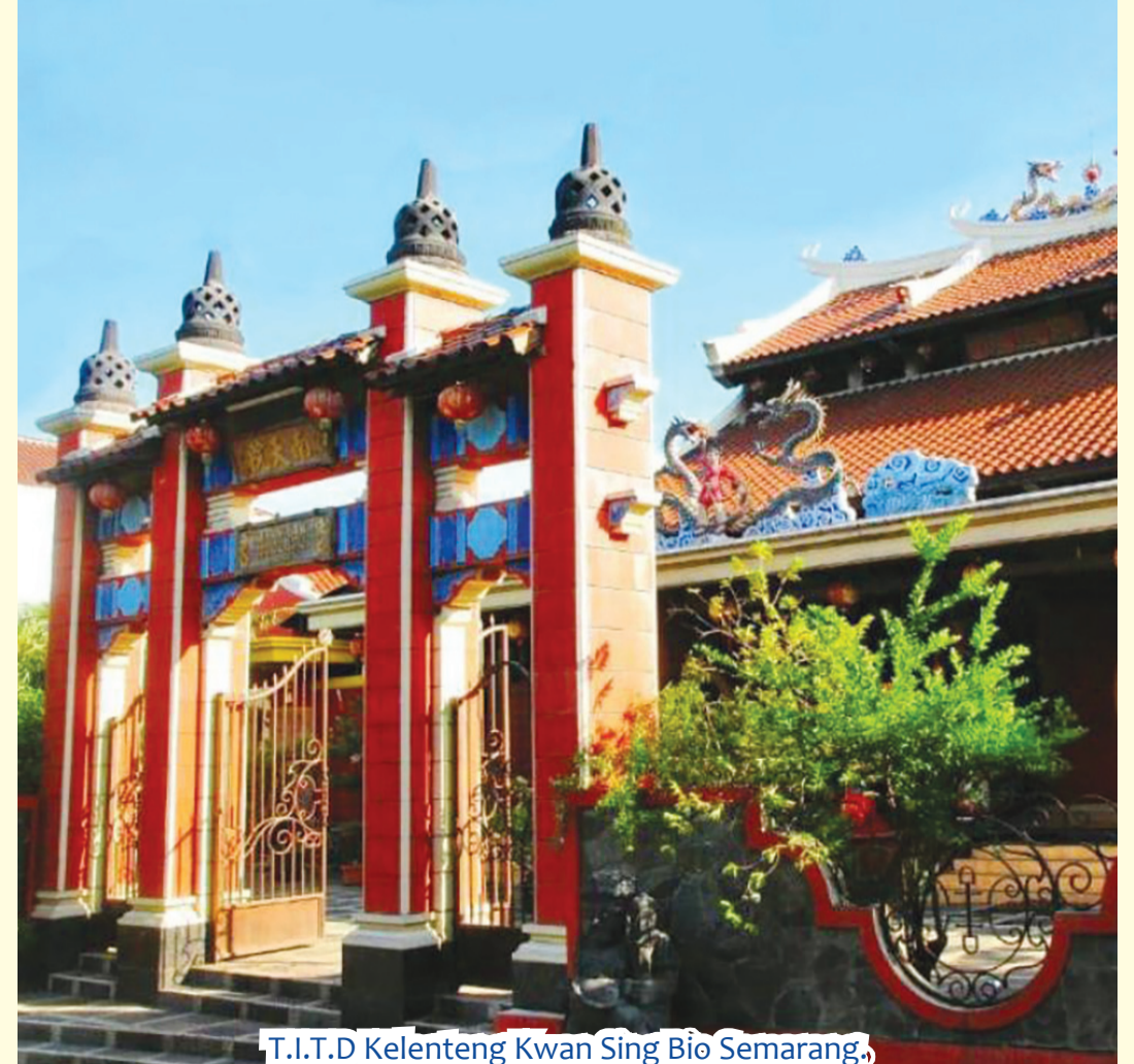
T.I.T.D Kelenteng Kwan Sing Bio Semarang.

Tanggul Mas Raya 9 Semarang. Beberapa Perkumpulan Liong Samsi (grup naga dan barongsai) dan juga grup kesenian musik tradisional khas Tiongkok Toa Kok Tjue dari Semarang akan ikut memeriahkan jalannya kirab ritual tersebut. Kirab berlangsung sekitar pukul 06.30 wib pagi hingga sekitar pukul 14.00 WIB. Panitia memohon maaf kepada masyarakat sekitar Tanah Mas, sekiranya apabila pada jam berlangsung nya Kirab tersebut ada sedikit kemacetan di jalan jalan yang di lalui Kirab Dewa tersebut. • tri