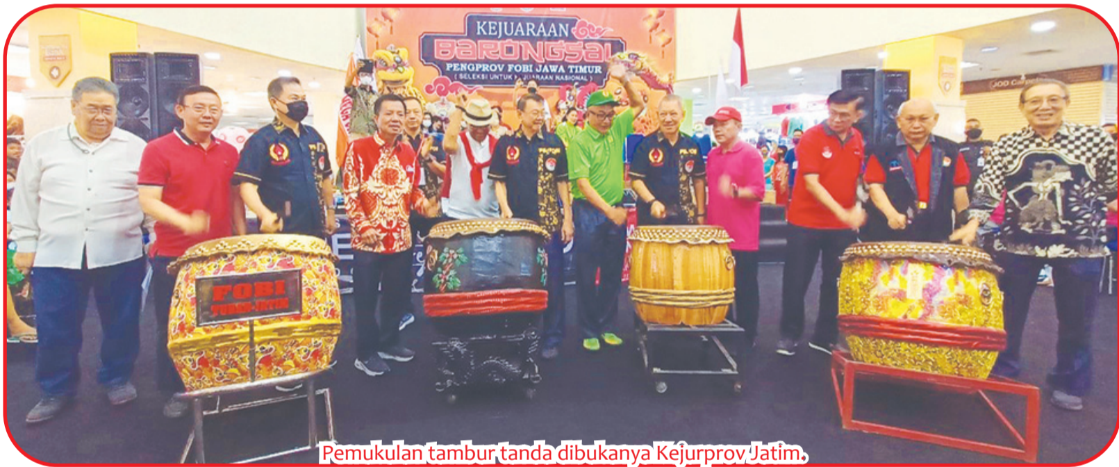
Pemukul tambur tanda dibukanya Kejurprov Jatim.