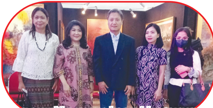
Para perwakilan sponsor dan pendukung pameran.