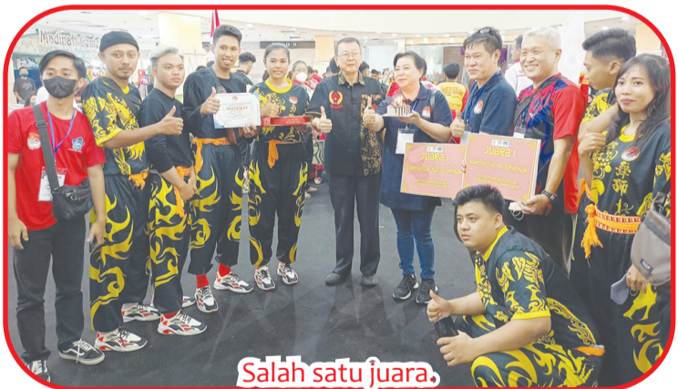
Salah satu juara.