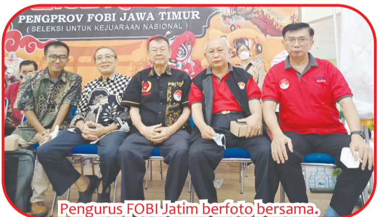
Pengurus FOBI Jatim berfoto bersama.