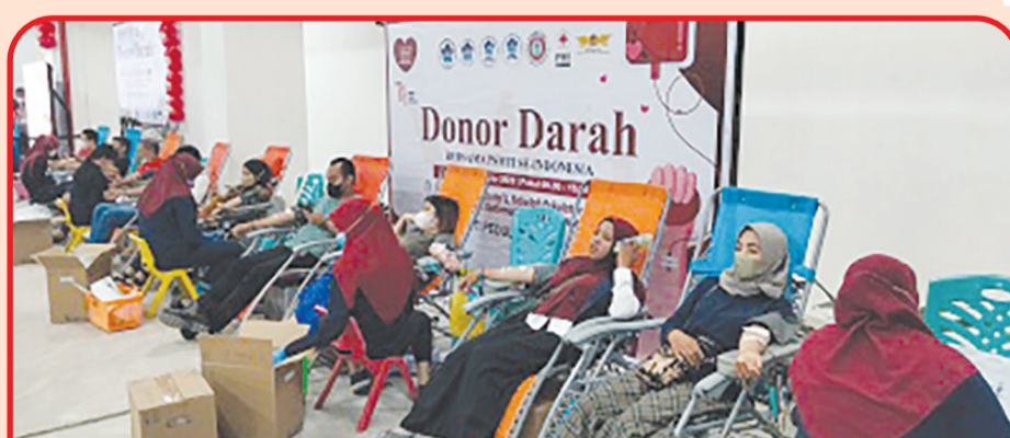
Suasana donor darah di Mal Pekanbaru yang diselenggarakan PSMTI Riau bersama PSMTI Pekanbaru, PSMTI Kampar dan Perwanti Riau.

Dia menambahkan dengan adanya MoU dengan PMI, maka dalam satu tahun minimal dilaksanakan 3 kali donor darah serentak. Terkait kegiatan donor