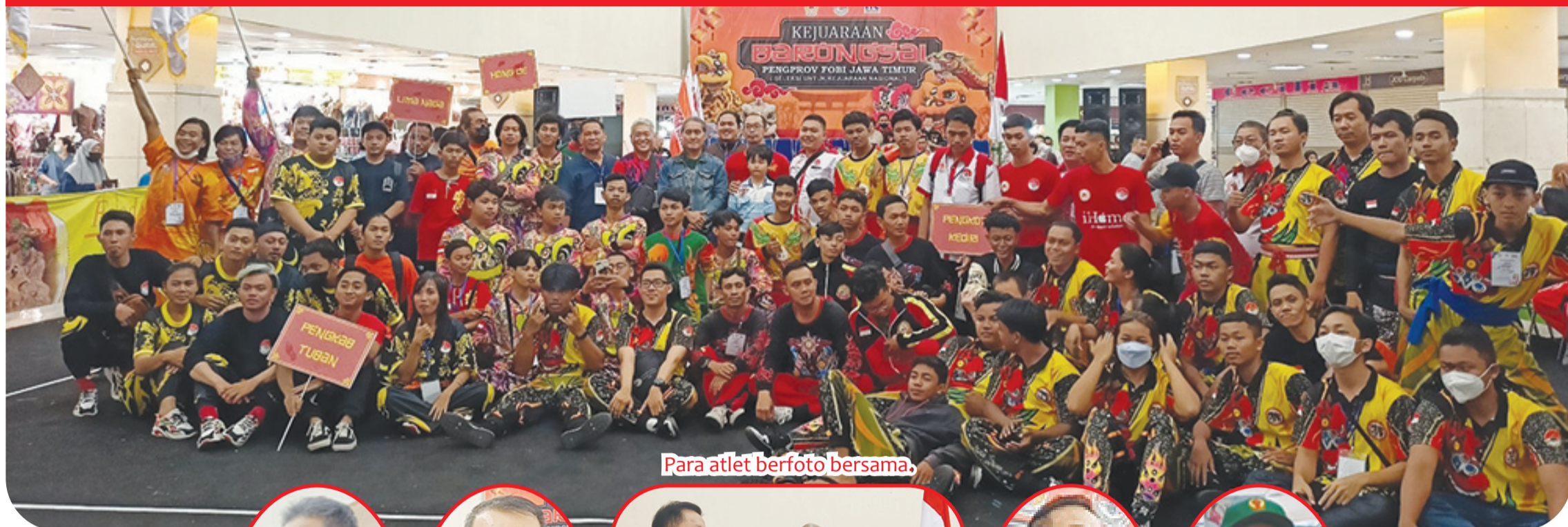
Para atlet berfoto bersama.

SURABAYA (IM) - Selama dua hari, Sabtu (24/9) - Minggu (25/9), pengurus FOBI (Federasi Olahraga Barongsai Indonesia) Jawa Timur menggelar Kejurprov Provinsi (Kejurprov) yang diikuti 180 Atlet dari 11 Pengkot/Pengkab.