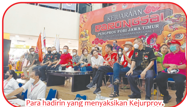
Para hadirin yang menyaksikan Kejurprov.