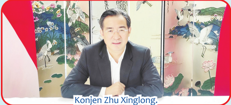
Konjen Zhu Xinglong.

DENPASAR (IM) - Menjelang peringatan HUT Kemerdekaan Tiongkok ke-73, Konsul Jenderal Tiongkok di Denpasar Zhu Xinglong Senin (26/9) lalu diwawancarai TVRI NTB, RRI NTB, Antara dan Lombok TV serta 10 media utama di Lombok untuk wawancara bersama secara online. Dalam sesi wawancara tersebut, Konjen Zhu Xing Long menjelaskan prestasi pembangunan dalam rangka